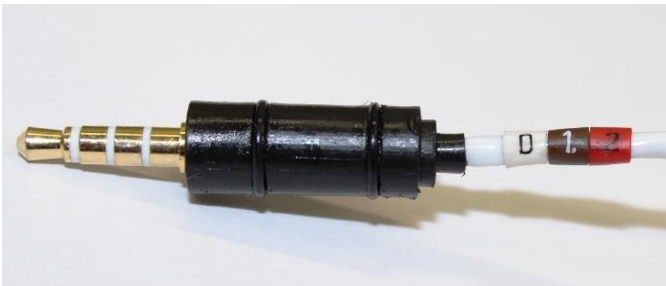
Obr.3 Série D, rok 2012 (značeno na kabelu řezací jednotky)