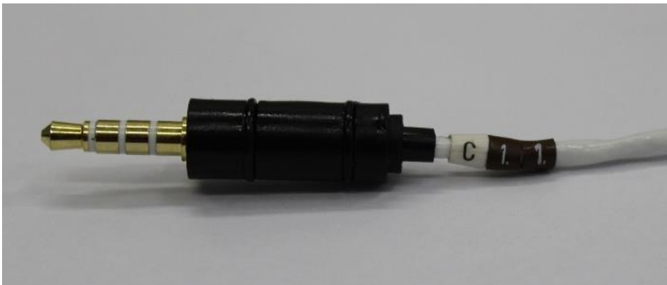
Obr.2 Série C, rok 2011 (značeno na kabelu řezací jednotky)