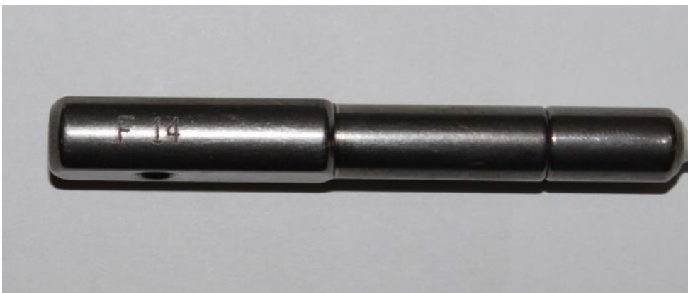
Obr.4 Série F, rok 2014 (značeno na těle řezací jednotky)