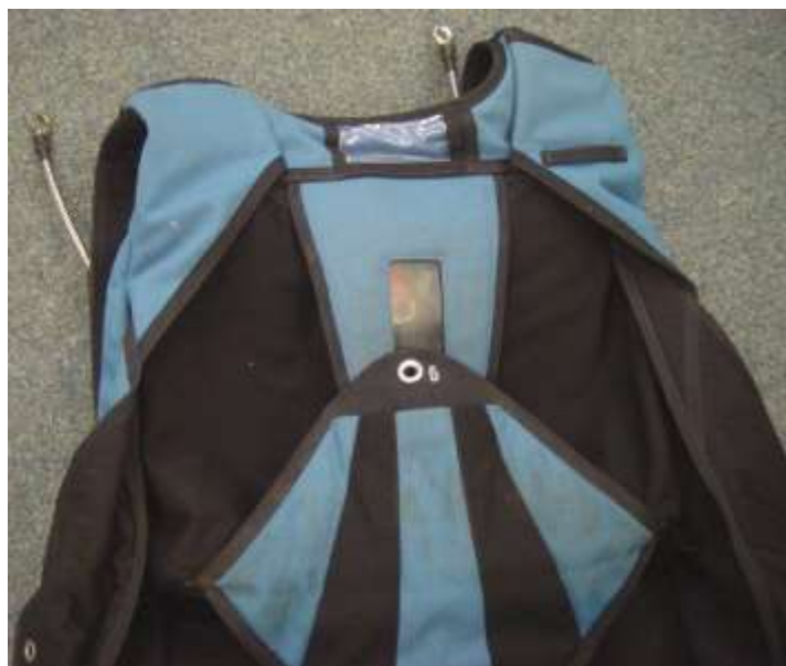
Obr. č. 2 – celkový pohled na obal záložního padáku