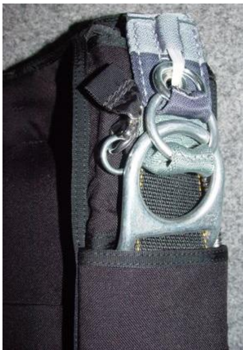
Obrázek č. 5

Pohled zepředu na připojenou karabinu k volnému konci.