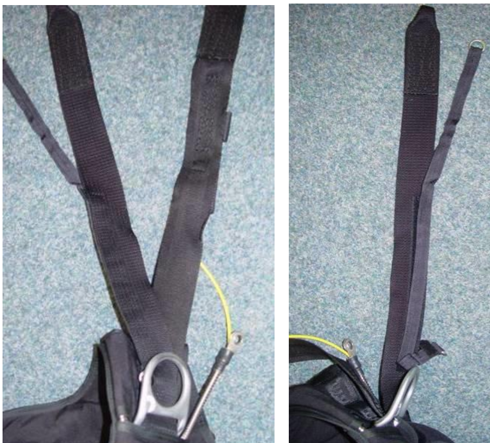
Obrázek č. 3, 4