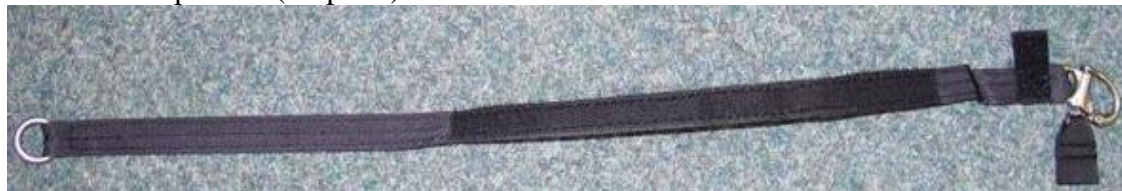
Obrázek č. 1

Po délce je na lemovce našit stuhový uzávěr (háčky), jež slouží k uchycení šňůry AOZP k přednímu popruhu záložního padáku (zespodu).