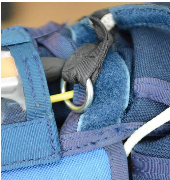
Obrázek č. 9

Zapojení kroužku mezi konci dělené hadice v horní části průkrčníku.