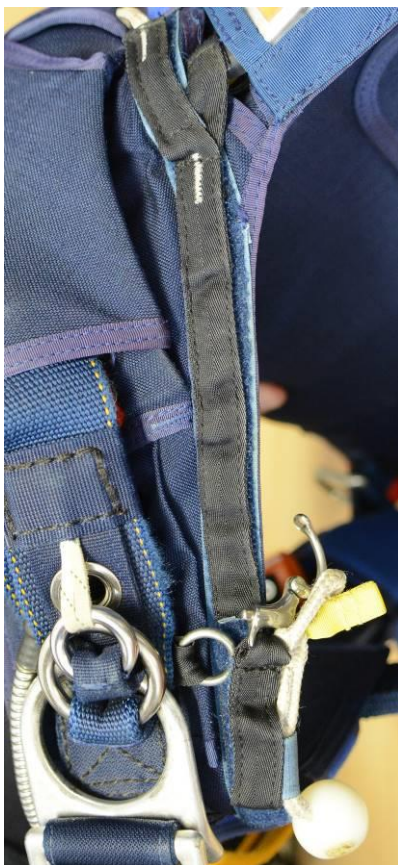
Obrázek č. 7

Pohled na šňůru AOZP-TANDEM přilepenou k pravému ramennímu vatníku.