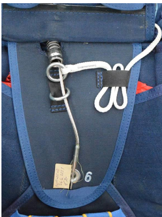
Obrázek č. 10

Pohled na správně zapojený kroužek systému AOZP-TANDEM a uzavřený a zapečetěný obal padáku.