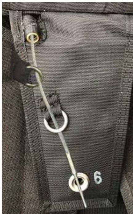
Provedení u Real-X